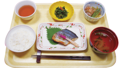
管理栄養士による献立各制限や加工食に対応