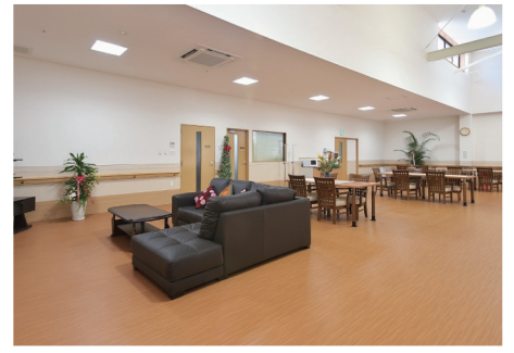
明るく開放感あふれるリビング